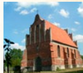
Warzymowo. Former parish church. Family nest of Pomian coat of arms family, and representatives of this family were enumerated among eminent Kuyavian officials

Pages of the chronicle written by Długosz also mention Marcin from Sławsk, governor of Kalisz, known as one