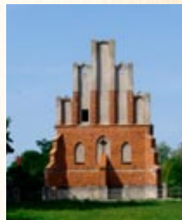
Warzymowo. Dawny kościół parafialny. Gniazdo rodowe rodziny herbu Pomian, której przedstawiciele należeli do grona wybitnych urzędników kujawskich

Szczególny okres to lata wielkiej wojny z zakonem krzyżackim, które Długosz opisuje pieczołowicie, przywiązując wielką wagę i podkreślając zasługi ludzi z Konińskiego. To przede wszystkim dwaj wielcy przedstawiciele polskiej elity urzędniczej, dzielni rycerze spod Grunwaldu – Marcin ze Sławska z rodu Zarembów oraz Janusz z Tuliszkowa, przedstawiciel znanej rodziny pieczętującej się herbem Dryja. To oni wraz z tysiącami bezimiennych bohaterów wojny 1409-1411 wzruszyli potęgę Zakonu Szpitala Najświętszej Marii Panny Domu Niemieckiego w Jerozolimie, którego drogą dyplomatyczną nie można było zmusić do zadośćuczynienia krzywdom wyrażonym Królestwu Polskiemu w XIV i początkach XV stulecia. Z tego dyplomatycznego kręgu – po blisko 600. latach – wypada przypomnieć Andrzeja Łaskarza