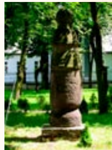
Konin. Road post with inscription dating back to 1151