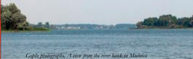
Gopło photographs. A view from the river bank in Mielnica

ticipant of a battle that took place on 15 July 1410 at the fields of Grunwald. This son was born only in 1415, so few years after the battle, but memories of these events was still alive at that time. He died in 1480, as a bishop of Przemyśl, a man of many merits for the state and respected diplomat. Due to his effort we can now enjoy the descriptive image of our fatherland.