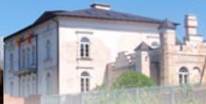
Sławska. Pałac w Sławsku posiadawiony na relikwiach dawnego dworu

chlina pod Koninem, królewski podkanclerzy od 1464 r. aż do śmierci.