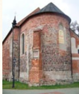
Kazimierz Biskupi – place of worship devoted to Five Brothers of Martyrdom, described by Jan Długosz

Among the people devoted to the matters of the state, faithful followers of Władysław II Jagiellon and his son Casimir IV Jagiellon, he mentions Piotr Wysz from Radolina, from a famous knightly family, bearing a stamp of Leszczyc coat of arms. He enabled magnificent carriers for his family and relatives. He was the bishop of Krakow (until 1412), then the bishop of Poznań (until 1414), and he was famous for restoring the University of Krakow in 1400. What is more, for several years he was the chancellor of this university. Since he was a relative of Zawisza Czarny from Garbów, a well-known knight in the European cultural circle, for many years he had the chance to meet the