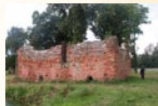
Włocławek Wielka, kamienica – dwór obronny na kopcu z XV w.