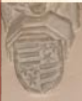
Coat of arms of Queen Anna Cylejska. Parish church in Goslawice

most important persons of the European political, religious and intellectual life. He stayed in Prague for many years, where he was connected with the University of Charles IV. At the beginning of the 15th century he visited Padua, where he became famous for being a rector of ultramotans, namely students coming from “outside the mountainous area”.