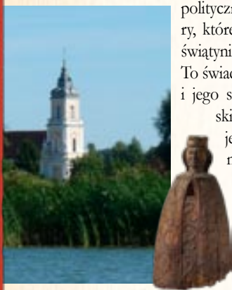
Skulsk – miejscowość legendami związana z czasami panowania Bolesława Chrobrego

politycznej XIV i XV w.; także dwory, które dziś są już ruiną, romańskie świątynie, przedziwne nagrobne płyty. To świadectwo obecności Konińskiego i jego społeczeństwa w dziejach polskiej państwowości. Jest to tylko jeden aspekt postrzegania naszej narodowej przeszłości. Niebawem przyjdzie nam wyruszyć w długą podróż po Polsce, po Europie, by tam szukać śladów naszej obecności – naszych przodków, którzy zaistnieli jako obywatele średniowiecznej Europy.