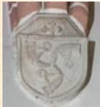
Herb Trąby Arcybiskupa Mikołaja. Kościół parafialny w Gosławicach

posadowiono go w połowie drogi pomiędzy Kaliszem a Kruszwicą. Fundację tego unikalnego w Europie zabytku także przypisał komesowi Piotrowi Duninowi. Słup drogowy (zwany obecnie Słupem Konińskim) niegdyś znajdował się na cmentarzu kościoła parafialnego w Koninie.