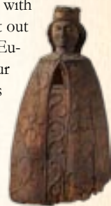
Skulsk – town related in legends with the reign of Bolesław I Chrobry

Visiting the lands around Konin with such an eminent guide as Jan Długosz is a chance to learn about all that remained in our cultural landscape since the time of our annalist. This is a journey following the traces of famous characters, who created Polish foreign policy, such as well-known diplomats and employees working in the chancery of the crown. It is a journey into the past, guided by the lecture of the magnificent opus written by Jan Długosz. This voyage allows us to see old castles, being family residences of prominent officials – enumerated among the Polish political elite of the 14th and 15th century; as well as manors that are now unfortunately ruined, Romance churches, and curious tombstones. This is a testimony proving the presence of Konin province and its inhabitants in the history of the Polish statehood. This is just one of many aspects related with perceiving our national past. Soon we will set out for a long journey across Poland and across Europe in order to search for the traces of our presence – our ancestors, who were known as citizens of the medieval Europe.