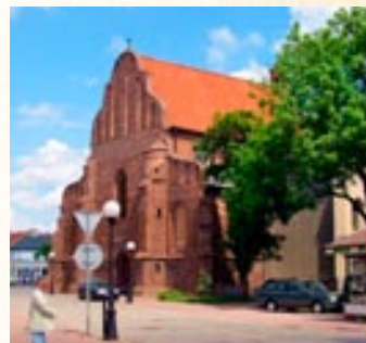
Konin. Fura św. Bartłomieja – przełom XIV i XV w.

Konin. Słup Dragony z inskrypcją z 1151 r.