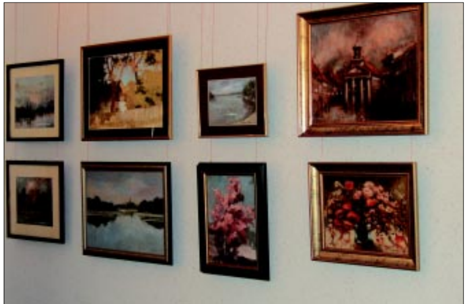
Fragment bogatej ekspozycji Powiatowej Galerii Malarstwa w CKiS w Koninie.

Od 4 lat, efekty ich pracy można podziwiać na cyklicznie organizowanych wernisażach poplenerowych, a od 30 maja 2003 roku w Powiatowej Galerii Malarstwa mieszczącej się w Centrum Kultury i Sztuki w Koninie.