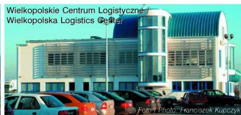
Wielkopolskie Centrum Logistyczne / Wielkopolska Logistics Center