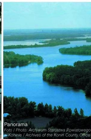
Panorama Foto / Photo: Archiwum Starostwa Powiatowego w Koninie / Archives of the Konin County Office

Z powiatu konińskiego jest wszędzie najbliżej!!! Konin County is centrally located, close to everywhere!!!