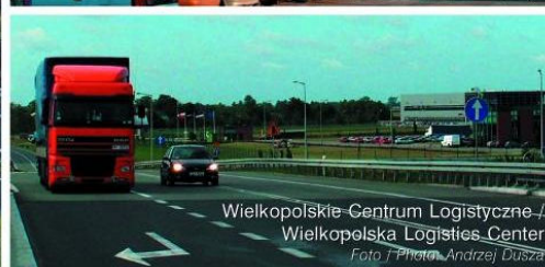
Wielkopolskie Centrum Logistyczne / Wielkopolska Logistics Center