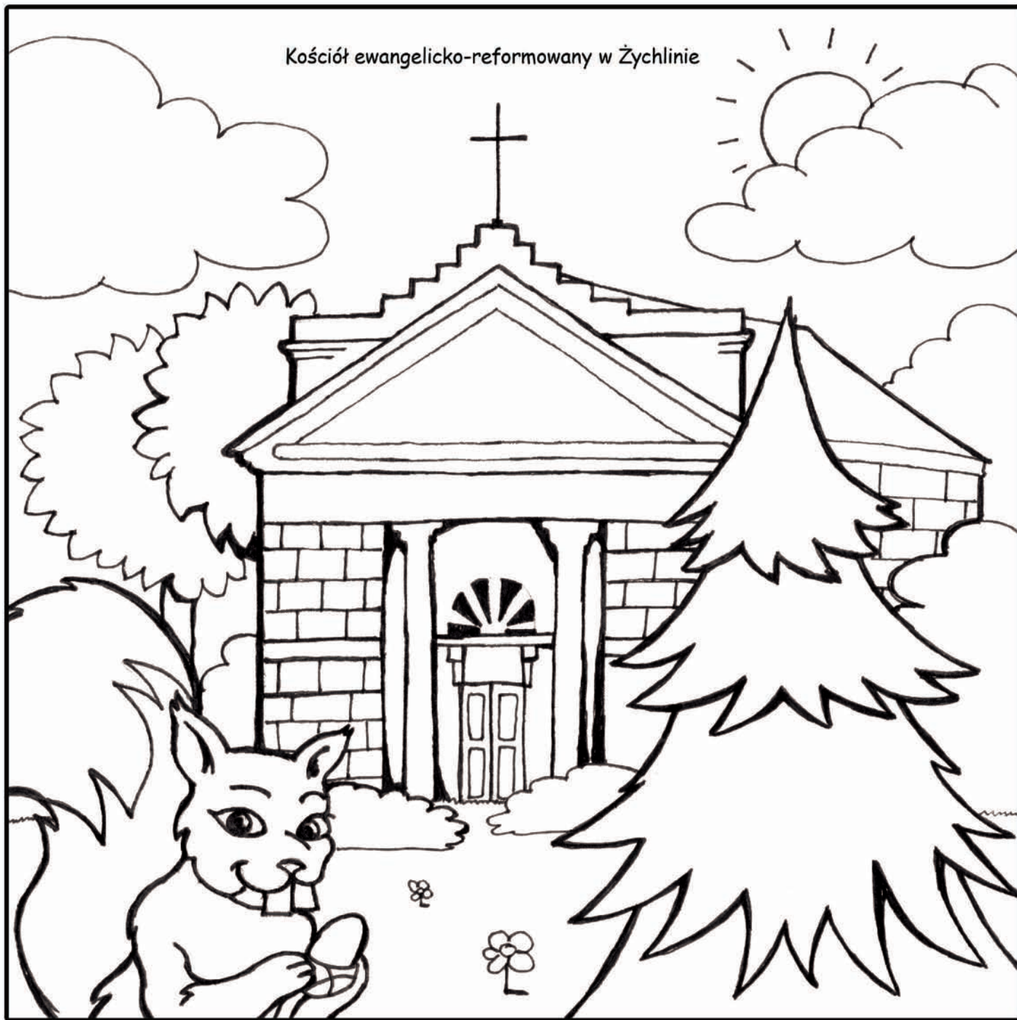
Kościół ewangelicko-reformowany w Żychlinie